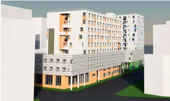
Renderings © Stika &amp; Stingl ZT GmbH